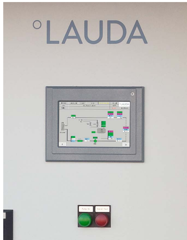
Panel de control del equipo de refrigeración para procesos

Un ejemplo de los retos técnicos que conlleva el uso y el suministro de hidrógeno se encuentra en la estación de repostaje de hidrógeno. Esta permite una comparación limitada con una estación de servicio convencional de gasolina o gasóleo dado que el repostaje en forma de líquido suele ser interesante en el caso de los vehículos pesados (p. ej., trenes o barcos), para los que es necesario almacenar cantidades mucho mayores de hidrógeno. Los turismos suelen repostar con hidrógeno gaseoso. Las diferencias con las estaciones de servicio conocidas hasta ahora comienzan ya con el abastecimiento. En primer lugar, el hidrógeno se suministra mediante un sistema de transporte especial, en grupos de depósitos a más de 1000 bares. A continuación, dichos grupos se vacían progresivamente en la estación de servicio y, por debajo de 700 bar interviene el compresor de H 2 . El hidrógeno gaseoso alcanza en este caso una densidad del 56 % del estado líquido. No obstante, es necesario disipar el calor generado durante la compresión. Esto se realiza con un dispositivo de refrigeración que suministra al compresor un agente refrigerante (caloportador) a una temperatura constante de -18 °C. Para ello, LAUDA ha modificado un enfriador de circulación del tipo Ultracool para alcanzar la temperatura requerida. Para el proceso de repostaje propiamente dicho se requieren temperaturas aún más bajas: para el enfriamiento previo se necesitan -40°C.