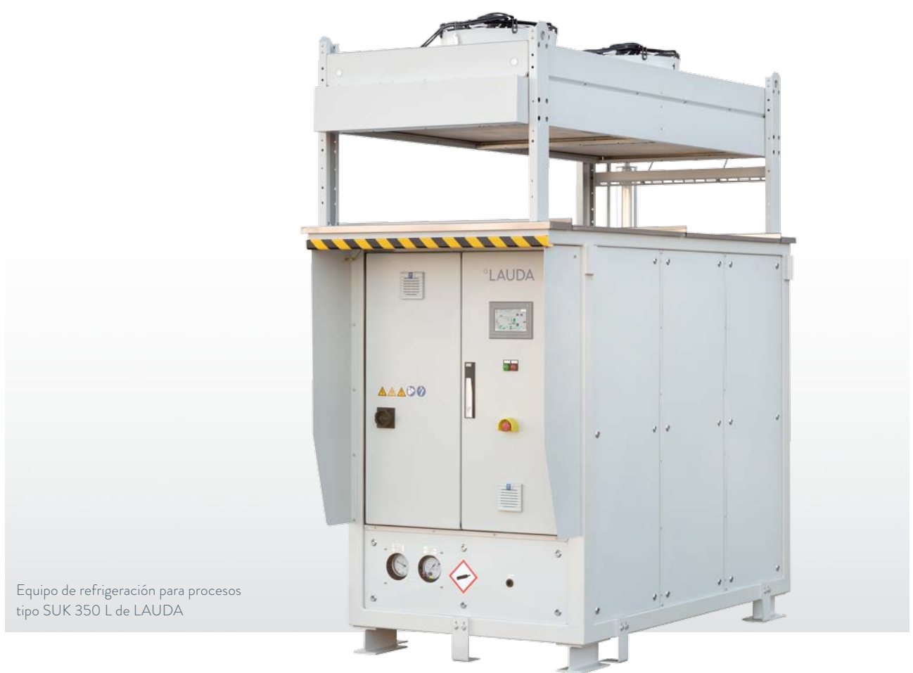
Equipo de refrigeración para procesos tipo SUK 350 L de LAUDA

Estas temperaturas más bajas son necesarias debido a que la especificación de los depósitos de hidrógeno de los vehículos suele llegar hasta un máximo de 85 °C. Sin embargo, repostar con una presión de 700 bar comprime fuertemente el gas restante en el depósito y lo calienta. Esta es la razón por la que el hidrógeno debe someterse a un enfriamiento previo para absorber esta energía térmica. Por lo tanto, para introducir de 4 a 5 kg en el depósito de un turismo en cuatro minutos, se necesita una gran potencia de frío en un tiempo breve. Poco después del inicio del proceso de repostaje, dicha potencia es de 40 kW durante un período de unos 20 segundos. Aquí es donde se pone de manifiesto una de las ventajas de la refrigeración indirecta, tal y como la aplica LAUDA: utilizando un sistema de almacenamiento de forma que solo sea necesario dimensionar el sistema de refrigeración para una potencia de 20 kW.